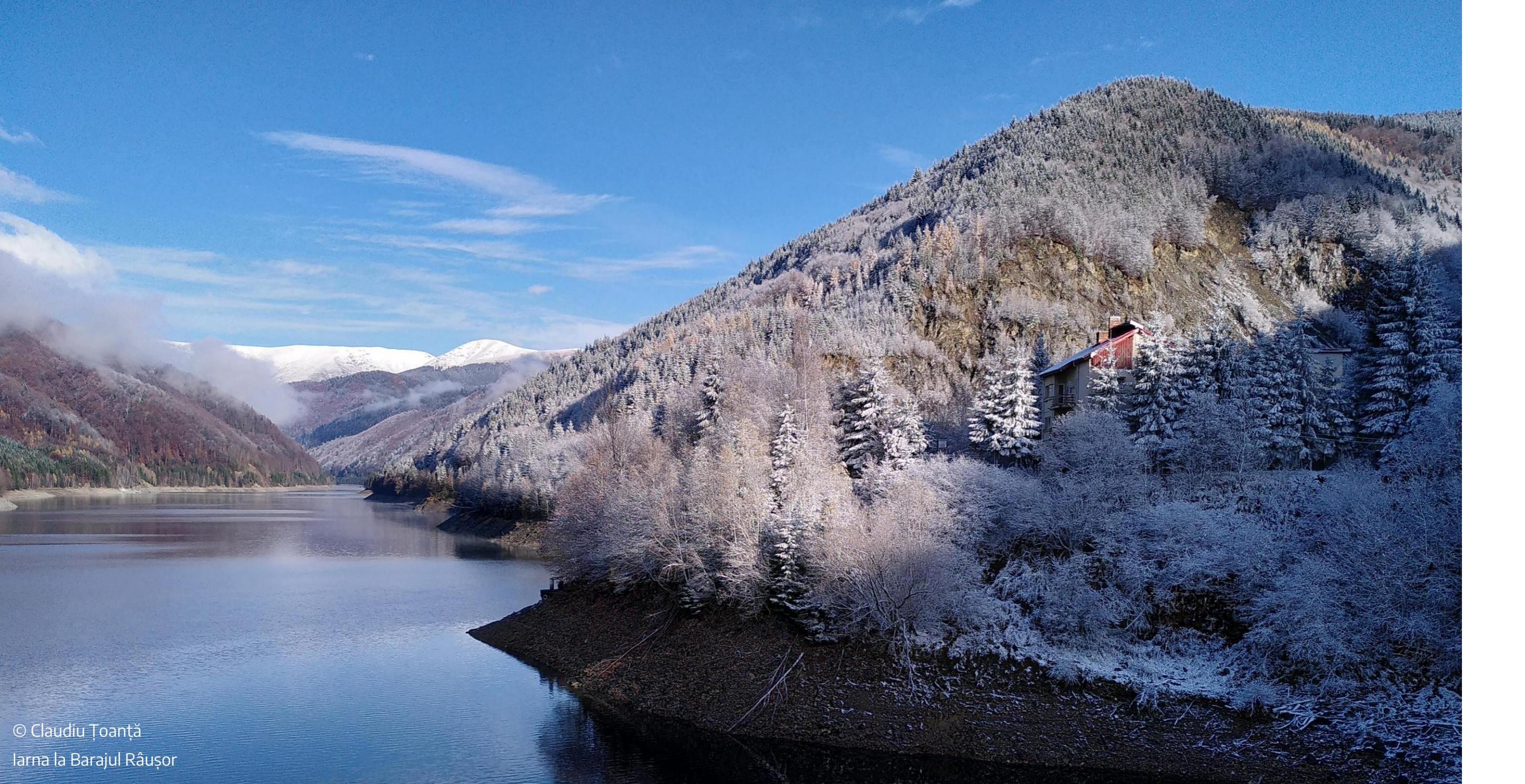
Iarna la Barajul Râuşor