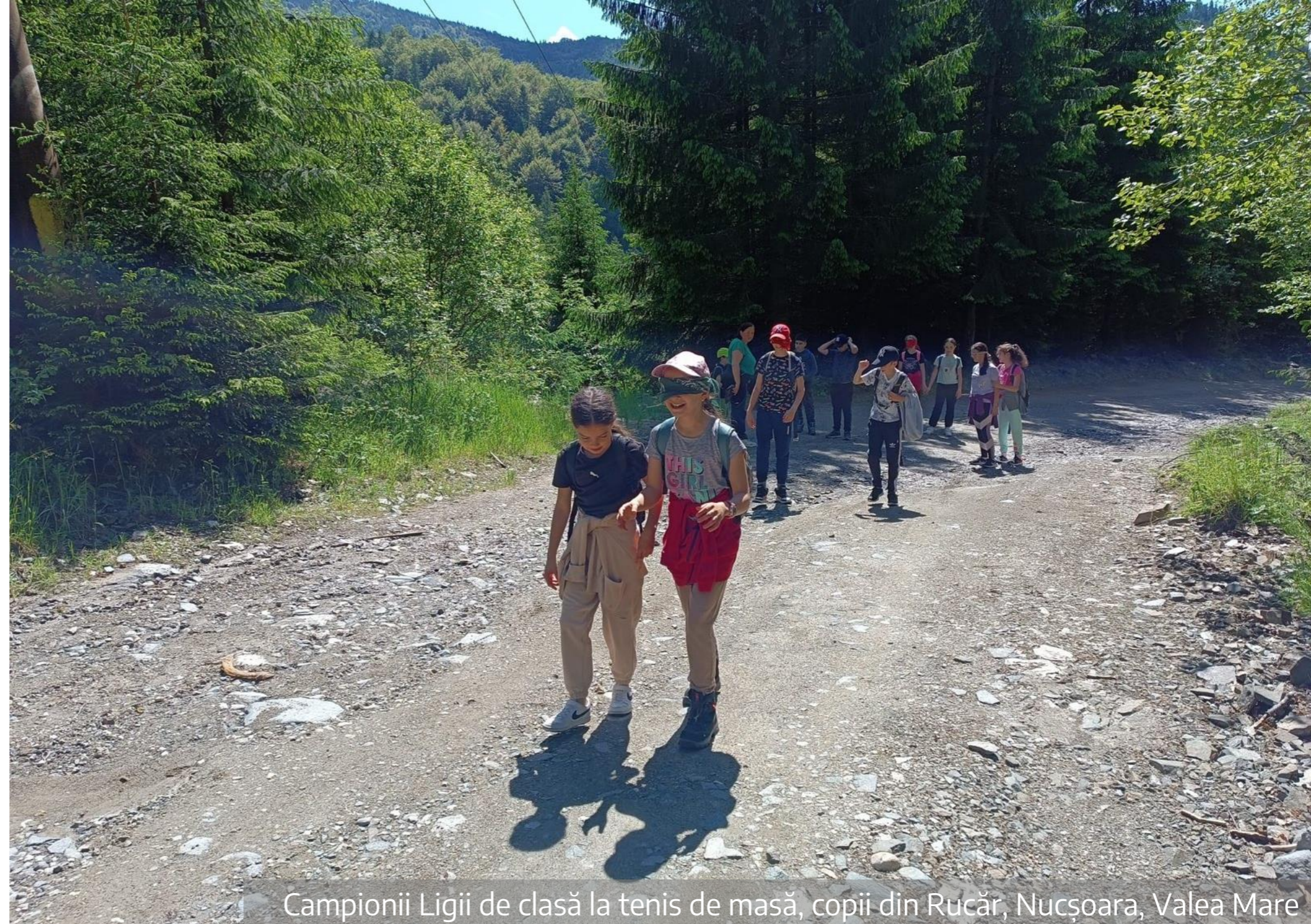
Campionii Ligii de clasă la tenis de masă, copii din Rucăr, Nucșoara, Valea Mare

Au jucat cu clasă tenis de masă și au câștigat o tabără de 3 zile la Centrul pentru Activități și Explorarea Naturii Richita. Unii ar spune că micii sportivi au explorat natura prin joc și mișcare. Noi zicem că, în plus, s-au distrat de minune!